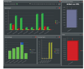
Dashboard: Alle KPIs auf einen Blick.